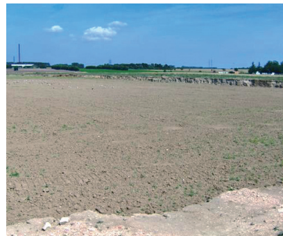
Det översta jordlagret och lera schaktas bort och efter brytningen fylls marken ut med matjord så att området kan användas som tidigare.

En sten i sågspånstegel väger mellan 30 och 40 procent mindre än en traditionell tegelsten.